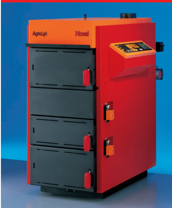
Hoval AgroLyt®: Auf Wunsch mit Verbrennungsregelung Hoval TopTronic®T lambda.

Konsequent auf Komfort getrimmt. Bei der Entwicklung des AgroLyt® stand neben der Wirtschaftlichkeit vor allem der Komfort im Vordergrund. Viele gesammelte Erfahrungen und Kundenwünsche sind eingeflossen. Resultat sind praktische Details, die den täglichen Umgang mit dem AgroLyt® zur Freude machen und Zeitersparnis bringen. Der grosszügige Füllraum etwa sorgt für lange Brennzeiten, was die Beschickungsintervalle verlängert. Die im oberen Bereich des Kessels integrierte, grosse Fülltür macht das Einlegen des Holzes bequem. Ein drehzahlvariables Saugzuggebläse regelt die Temperatur des Heizkessels und stimmt die Verbrennungsluft gezielt auf die benötigte Wärme ab. Mit der kinderleicht zu bedienenden TopTronic®T Regelung erfolgt eine dem jeweiligen Wärmebedarf exakt angepasste Wärmeverteilung. Die Reinigung mit den mitgelieferten Schürgeräten ist denkbar einfach und schnell erledigt.