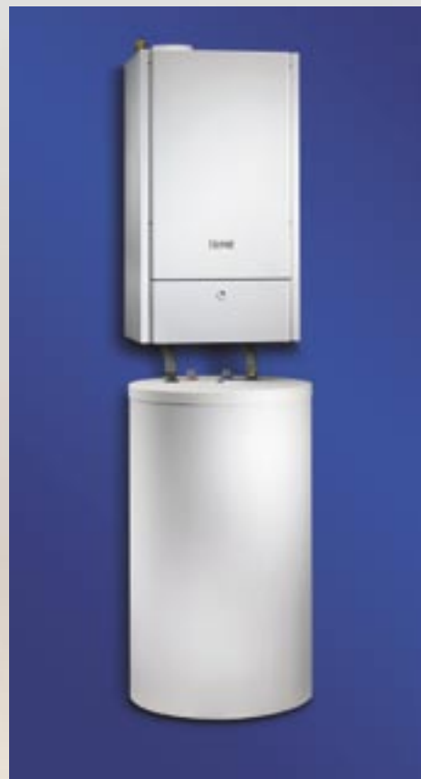
TopGas® comfort mit rundem Unterstellspeicher TopVal (160) R